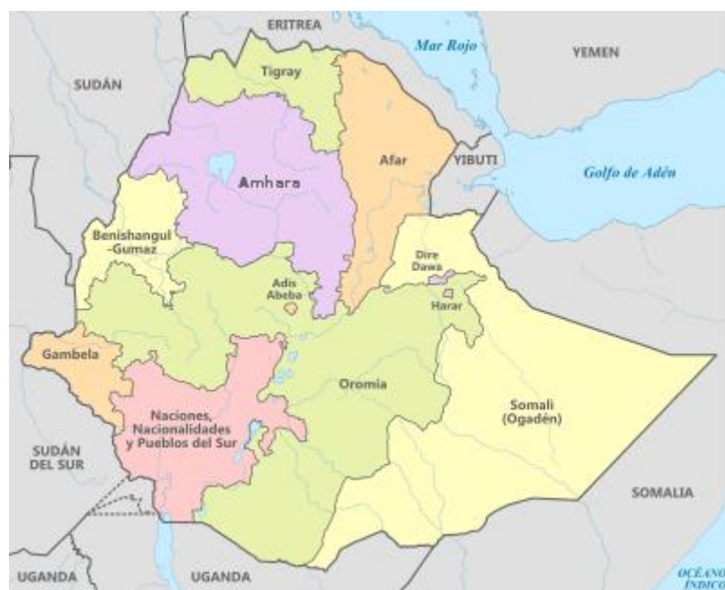
Mapa político de Etiopía