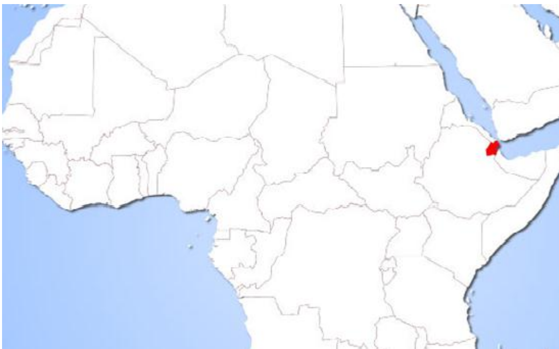
Ubicación de Etiopía en África