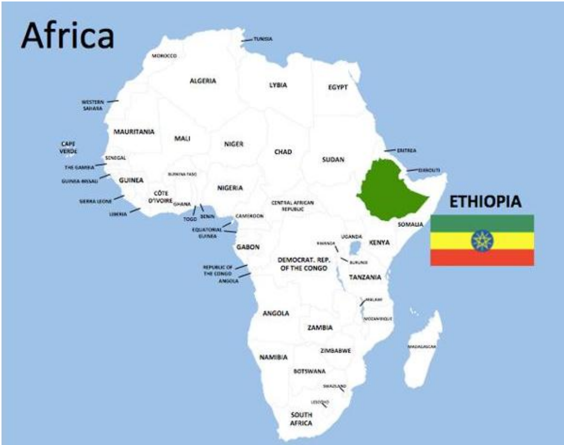
Ubicación de Etiopía en África