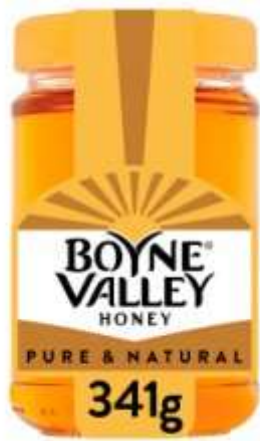
Boyne Valley Honey 341G €2.99