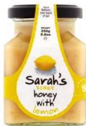
Sarah's Zingy Honey With Lemon 250G €2.99