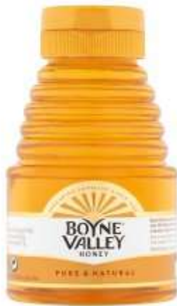
Boyne Valley Squeezy Honey 340Gr €3.29