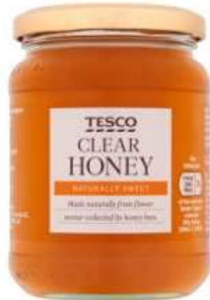
Tesco Every Day Value Clear Honey 454Gr €2.19