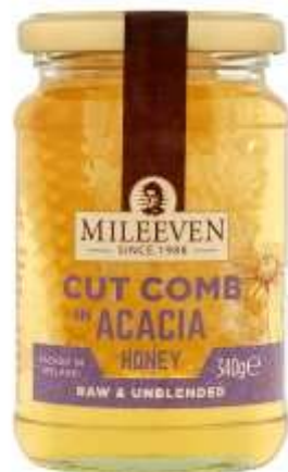
Mileeven Acacia Honey With Cut Comb 340G €5.99