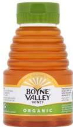
Boyne Valley Organic Honey 340G €3.89