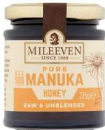
Mileeven Pure Manuka Honey MGO 500 225G €20.99