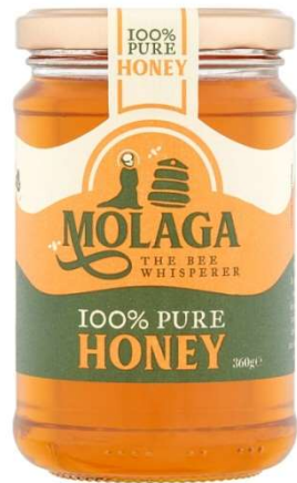
Molaga Honey Pure Honey 360Gr €4.49