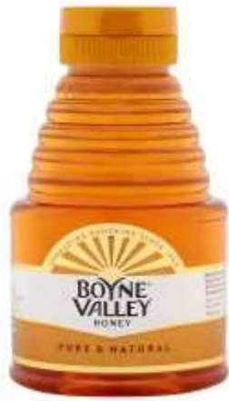
Boyne Valley Squeezy Honey 500Gr €4.39