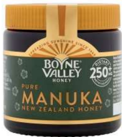
Boyne Valley Manuka Honey MGO 250+ 150G €14.99