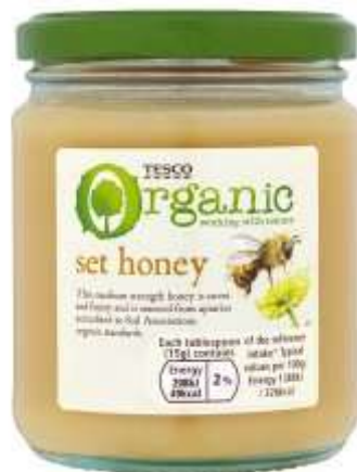
Tesco Organic Pure Set Honey 340G €3.19