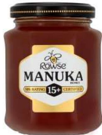
Rowse Manuka Honey MGO 15+ 250G €18.99