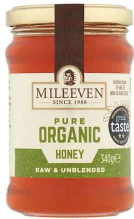
Mileeven Pure Organic Honey 340Gr €4.89