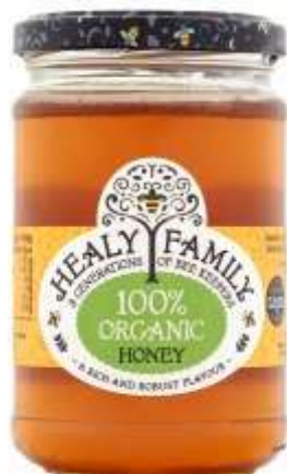
Healys Organic Honey 340Gr €3.49