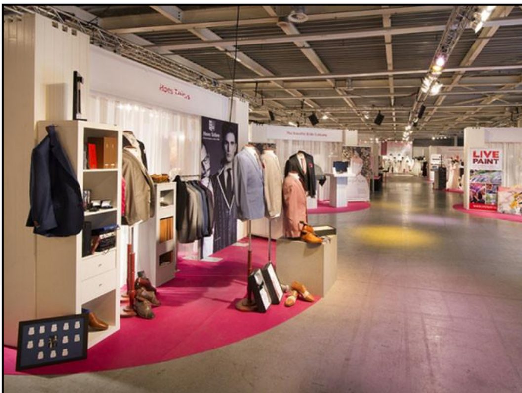
World Fashion Center – Amsterdam.

Según informe de la revista de moda Libelle (basando en investigación de la Universidad de Ciencias Aplicadas de Ámsterdam y MVO Nederland), los consumidores neerlandeses compran en promedio 46 prendas de ropa nuevas por año, a un precio medio por prenda de vestir de 16 euros cada una.