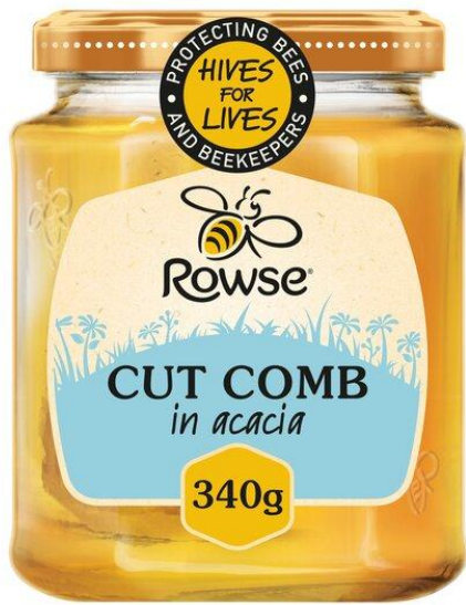
Rowse Cut Comb In Acacia Honey 340G