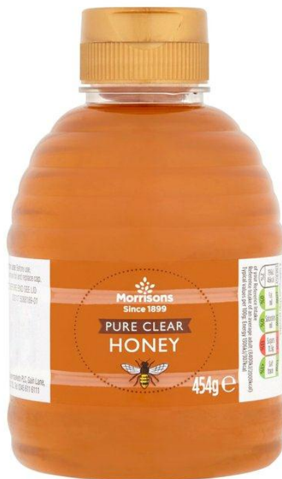
Morrisons Squeezy Pure Honey 454g