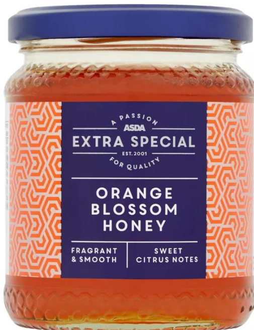
ASDA Extra Special Orange Blossom Honey 340g