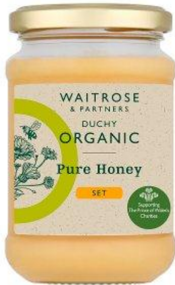
Duchy Organic Pure Set Honey 340g